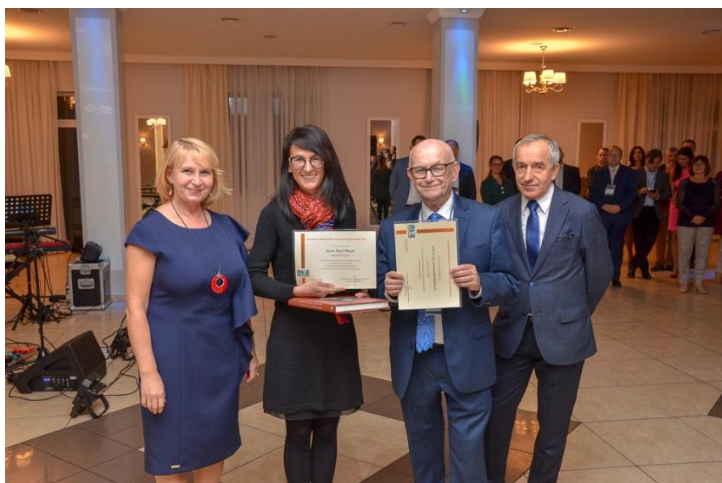
Rozdanie nagród w 2019 r.